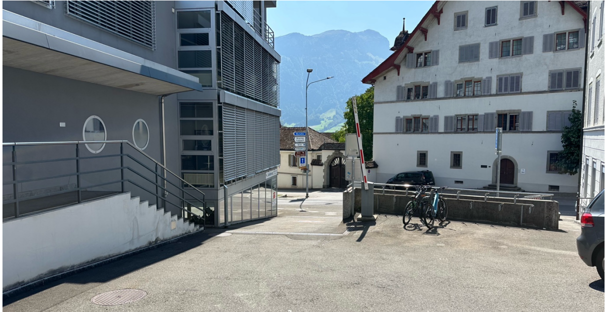
Einfahrt Anlieferung MythenForum